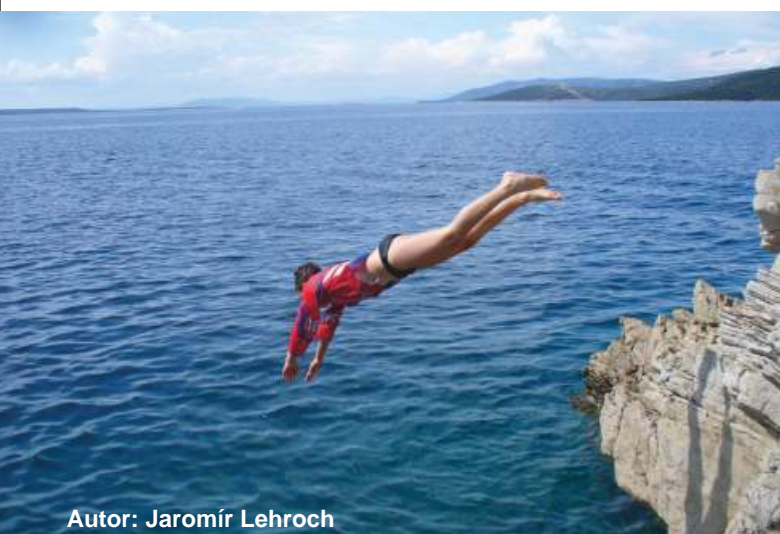
Autor: Jaromír Lehroch

Také redakce vám p eje dovolenou tak akorát, podle vašeho gusta. Na konci srpna vyjdeme zas.