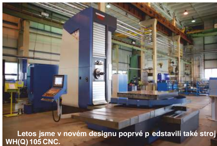
Letos jsme v novém designu poprvé představili také stroj WH(Q) 105 CNC.