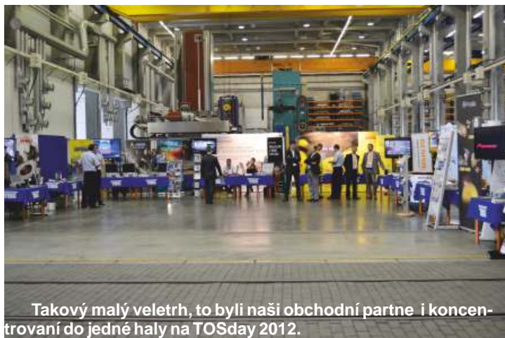
Takový malý veletrh, to byli naši obchodní partneři i koncentrování do jedné haly na TOSday 2012.