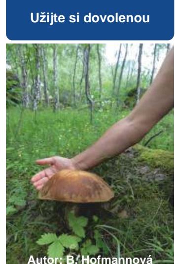
Autor: B. Hofmannová