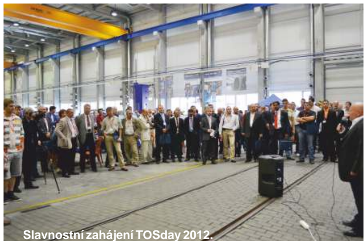
Slavnostní zahájení TOSday 2012.

na stroji WRD 130 Q obráběl ventil, menší bratríček toho z titulní strany letošního čísla 3. Pak se dostali ke stroji WHQ 13 CNC, kde jsme předvedli frézování a vyvrtávání trubkovnice. Ještě v lodi montážní tiskové mechaniky mohli obdivovat kompletně smontovaný stroj WHQ 13 CNC v novém designu. Po návratu do tiskové montážní haly si prohlédli všechny tam rozestavené stroje WRD. Ale to nebylo zdaleka všechno. Po celé firmě jsme umístili pracoviště, která bylo možné navštívit, takže například v bývalé montážní