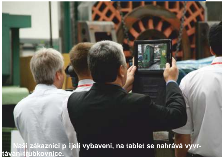
Naši zákazníci při jeli vybavení, na tablet se nahrává vyvrtávání trubkovnice.

Co se týká předpokládaného vývoje ve druhém pololetí letošního roku, jsou mi sice srpenec a srpenec svým zakázovým krytím, a tím i potenciálem pro tvorbu tržeb jako nezbytné podmínky tvorby dostatečné