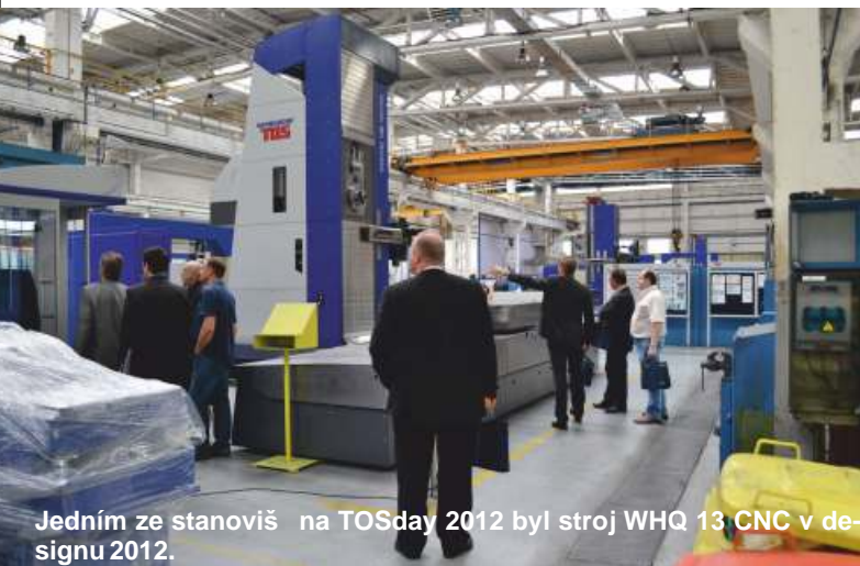
Jedním ze stanišť na TOSday 2012 byl stroj WHQ 13 CNC v designu 2012.

První letošní setkání vedení společnosti se zamstanci opět proběhlo ve firemním jídelně. Právě podobně naposledy, protože prosincové setkání možná již v novém školícím středisku, které právě v těchto dnech nezadržitelně kráčí ke svému stavebnímu dokončení. Toto letošní setkání proběhlo v úterý 19. června, souběžně s finálními přípravami na Zákaznický den TOSday 2012. To také možná bylo jednou z příčin, proč nebyl po setkání zamstanců na setkání takový, jaký jsme si zvykli předchozích roků.