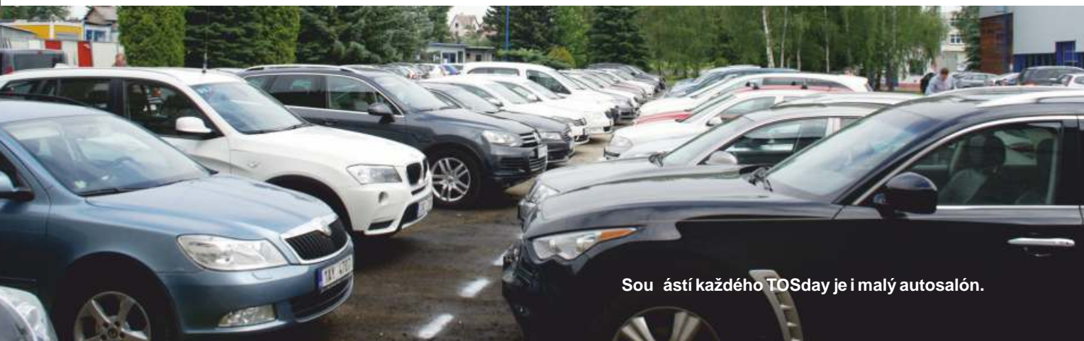
Součástí každého TOSday je i malý autosalón.