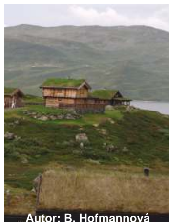
Autor: B. Hofmannová

Také redakce vám p eje dovolenou tak akorát, podle vašeho gusta. Na konci srpna vyjdeme zas.