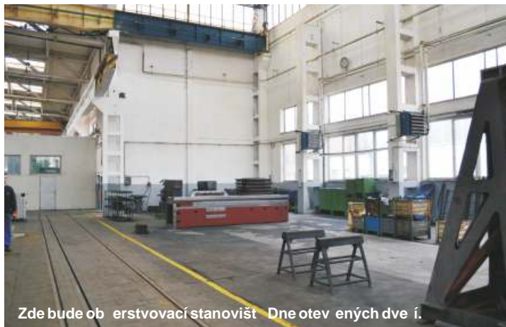
Zde bude ob erstvovací stanovišt Dne otev ených dve í.

Budete pak pokrač ovat podél nové montážní haly a hned za ní odbo íte podél zdi vlevo a p ekro íte koleje a u druhých kolejí se vydáte do haly t žké mechaniky, kde hned za vstupními vraty je ono zkraje zmín né stanovišt ob erstvení. Zde je umíst no poprvé, ale jist nezabloudíte. A pro je práv zde? V nové montážní hale prost není místo, jsou v ní všude rozmíst ny montované stroje. Nová montážní hala je p ístupná hned n kolika vchody a m žete vid t n kolik stroj WRD, minimáln jeden stroj TOSTec PRIMA a adu dalších stroj v ur íté fázi montáže. Projít halou doporu ujeme návšt vník m s ko árky, protože p echod p es koleje kolem haly je trochu obtížn jší a vyžaduje zna nou zručnost a manévrovací schopnosti. V hale t žké mechaniky najdete v lodi obvyklou adu stroj z produkce TOSu, na n kterých z nich se bude pracovat, stejn tak se m žete zastavit v m ícím st edisku se stroji ZEISS, jist vás však p ítáhne montážní plocha, kde bude n kolik t ínátek a najdete zde i stroj patnáctky, tedy WHN(Q) 15 CNC, žhavou novinku v našem výrobním programu. Zcela jist vás zaujme zakrytovaný stroj WHN 13 CNC, který bude vévodit montáži a byl hlavním tahákem lo ského Zákaznického dne TOSday. Vedle rodiny stroj TOSTec (PRIMA, OPTIMA a VARIA) se jako nový p írstek objeví obráb cí centrum SPEEDtec, které je zde oživováno po p est hování z prototypové dílny. Svým designem jist zaujme všechny návšt vníky.