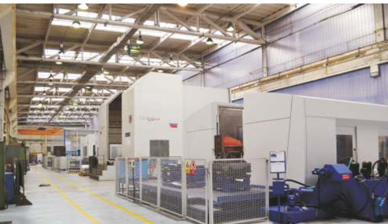
K rodin TOSTec p íbyl nejmaldší bratránec - obráb cí centrum SPEEDtec (úpln vpravo).