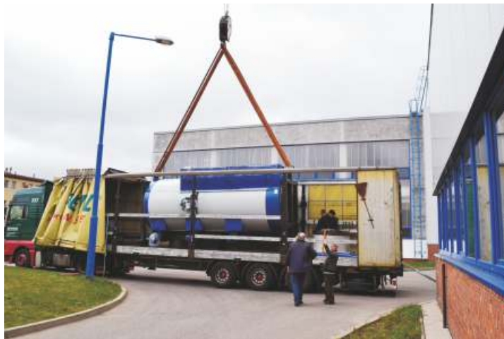
Naho e vidíte práv vykládanou novou nitridací pec (2. dubna 2012), dole je WHN 13 CNC s krytovaním vzor 2011, na pravém okraji fotografie je vid t ást montované patnáctky.