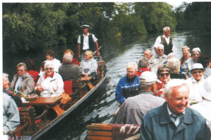
Zájezd do SRN - Spreewald.

Někdo by mohl říci, že popsání činnosti není nějak velká, avšak nutno podotknout staré heslo: kdo nic nedělá, nic nezkaží. To znamená, že když nikdo nic nezorganizuje, nemusí nic zkažit, ale také nic nevytvoří. Pak by nemělo ani cenu KS držet při životě, čímž by Klub přestal