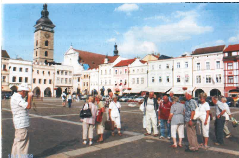
Na náměstí v Českých Budějovicích.

HORIZONT, firemní noviny , vydává pravidelně TOS VARNSDORF a.s., IČO 27327850.