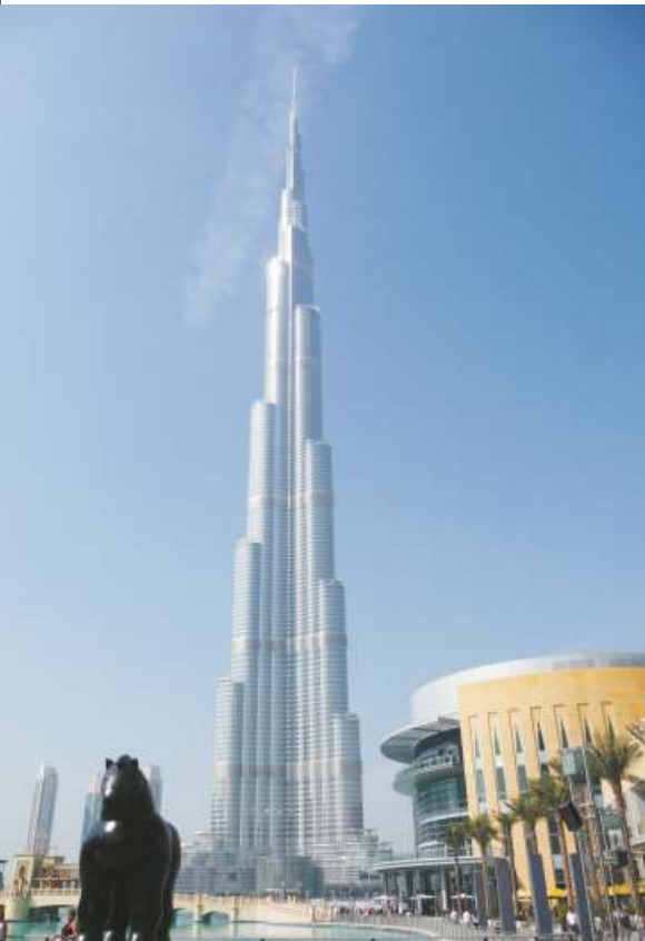
Fotografii prozatím nejvyšší budovy sv - ta Burj Khalífa na titulní stran a zde do- dal Št pán K íž. V p íštím ísle se dozvíme, jak se rozvíjí náš prodej v Emírá- tech.