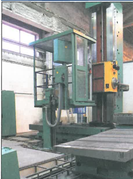
Dvoutisícový stroj WHQ 13 CNC dne 13. ledna. V příštím čísle přineseme více.