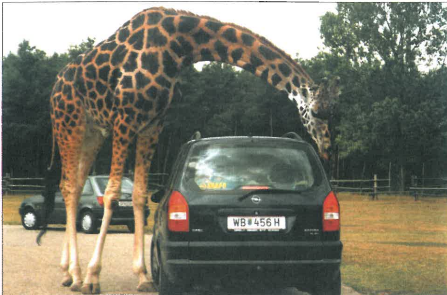
Jeden z námětů, jak prožít letošní dovolenou, nabízí fotograf Jiří Kotyk