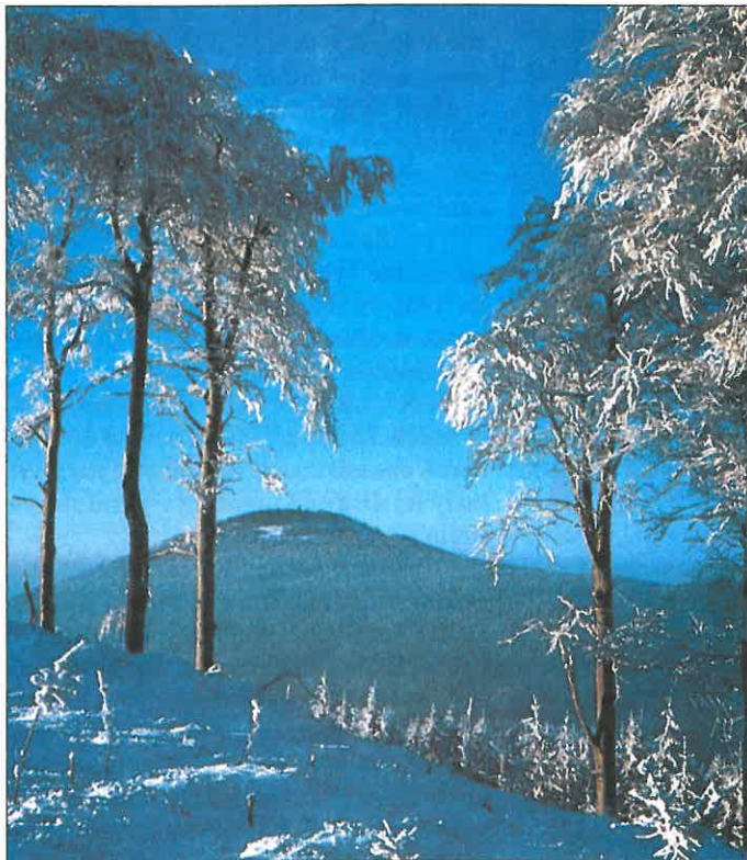
Zasněžená Jedlová s okolní krajinou zve k zimním vycházkám a sportům zvláště ve vánočních dnech.