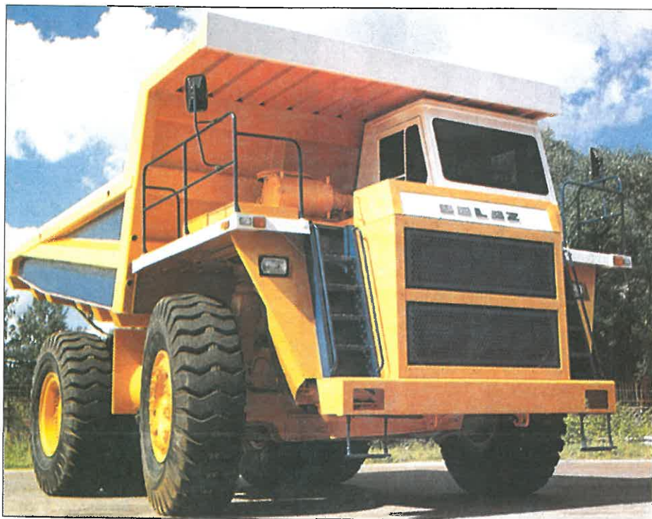
Jeden z výrobků automobilky BELAZ, která vyrábí nákladní automobily od 40 do 280 tun.

Po vánoční přestávce vyjde v novém roce první číslo našich novin v pátek 15. ledna 1999.