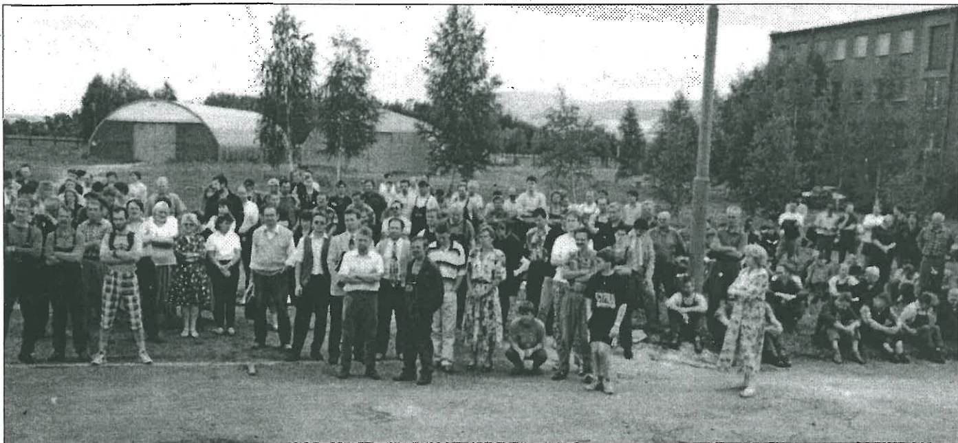
Shromáždění zaměstnanci TOS VARNSDORF byli na mítinku s vedením firmy seznámeni s připravovanými změnami v organizaci a řízení podniku. Zprávu ze setkání uveřejňujeme na 2. straně.