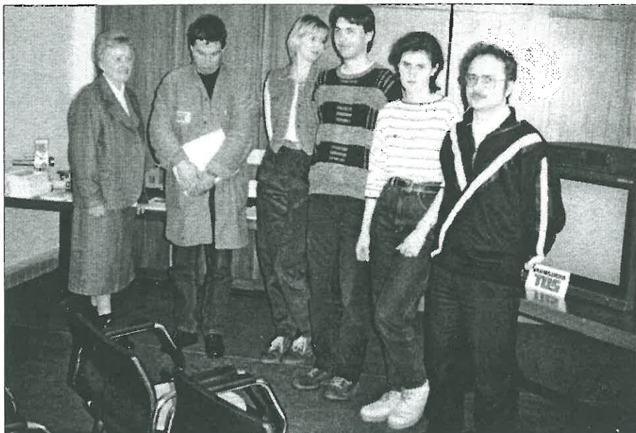
Část členů pracovního týmu nejen z personálního odboru, kteří se podíleli na zdárném průběhu Dne otevřených dveří učiliště a průmyslovky.