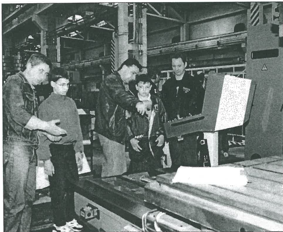
Den otevřených dveří v TOS VARNSDORF u příležitosti 95 let strojírenské výroby využilo přes jeden tisíc občanů města k návštěvě všech provozů firmy. Nejvíce návštěvníků bylo z řad tosáckých rodin. Jak dokumentuje náš záběr, zvláště tatínkové rádi předvedli svým synům stroje, na jejichž výrobě se každodenně podílejí.