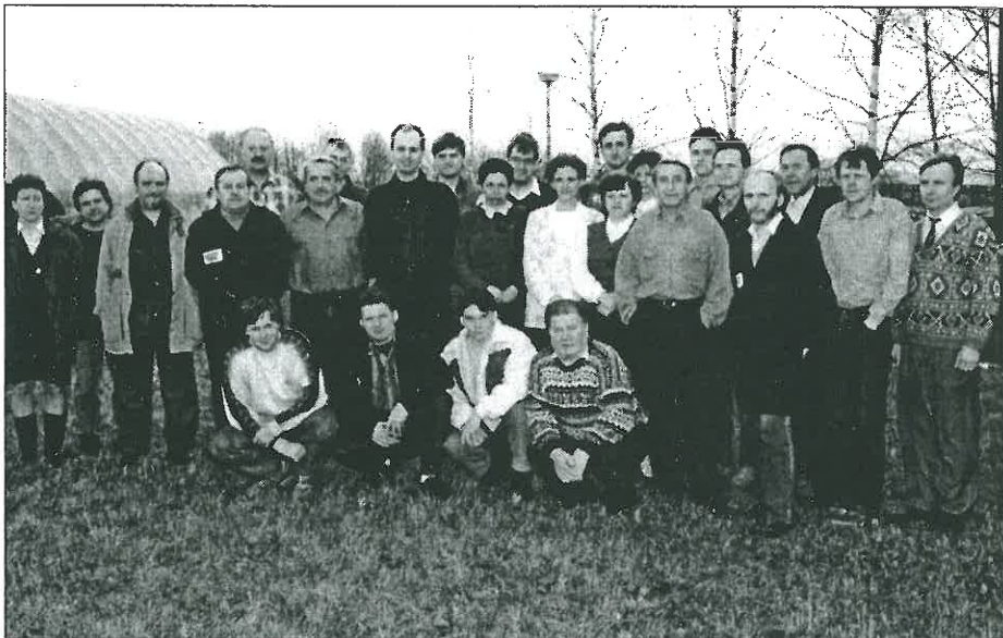
Početný kolektiv pracovníků útvaru vývoje TOS VARNSDORF.