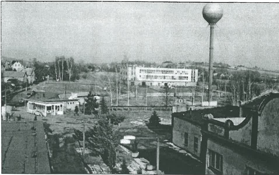
Panorama vstupního areálu TOS dozná v příštím roce podstatných změn