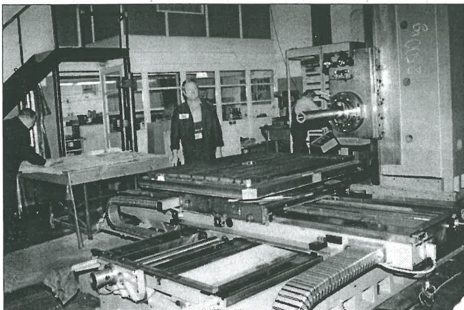
Montáž a ožívování prototypu stroje WH 105 je v plném proudu.